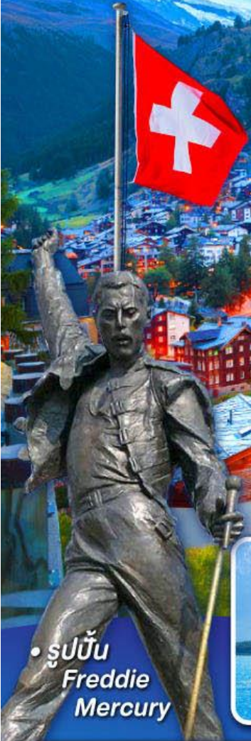
• รูปปั้น Freddie Mercury

พีชิต 5 เวารีกี, เวาฮาร์เตอร์คุม, เวาจุงเฟรา เวากลาเซียร์ 3000 และ เวากรอนเนอร์แกรต