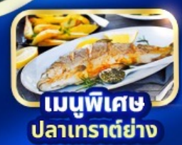
เมนูพิเศษ ปลาเทราต์ย่าง