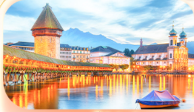
สะพานไมซ์าเปค