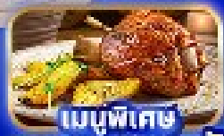
เมนูพิเศษ ขาคูเยอรมัน