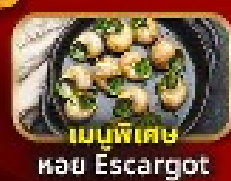
เมนูพิเศษ หอย Escargot

แถมฟรี! น้ำดื่ม 1 ขวดทุกวัน, ปลั๊กไฟยูนิเวอร์แซล