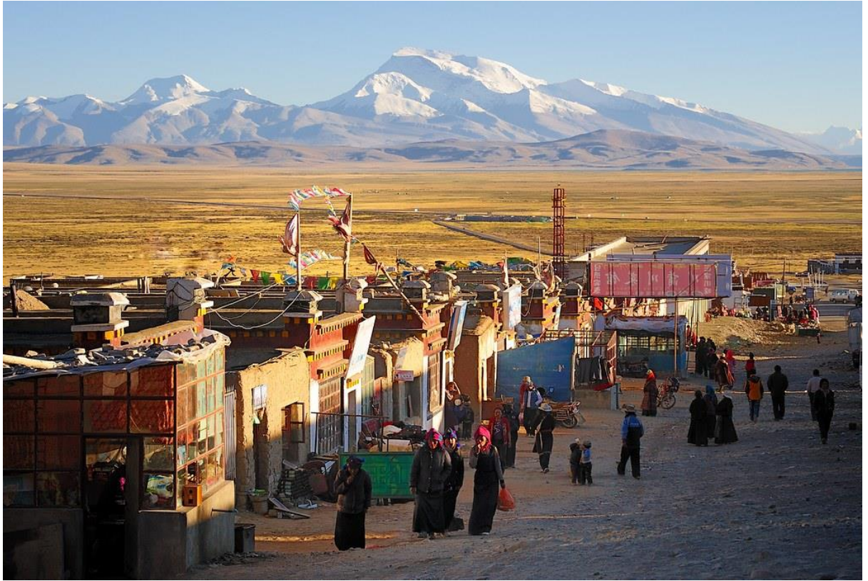
ที่พัก Dharchen Himalaya hotel