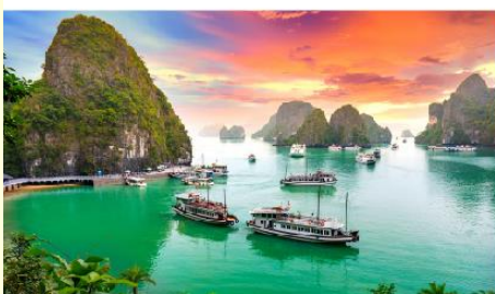
ล่องเรือชมอ่าวฮาลอง