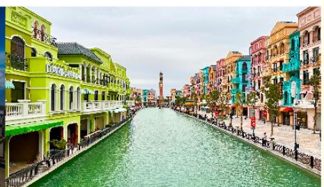
เมกาแกรนด์เวิลด์ฮานอย

*ทางบริษัทฯ ขอสงวนสิทธิ์ในการสลับโปรแกรมทัวร์ตามความเหมาะสมขึ้นอยู่กับสถานการณ์หน้างาน โดยคำนึงถึงผลประโยชน์ของลูกค้าเป็นสำคัญ