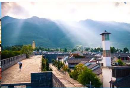
หมู่บ้านซีโจว(หมู่บ้านชาป๋อ)