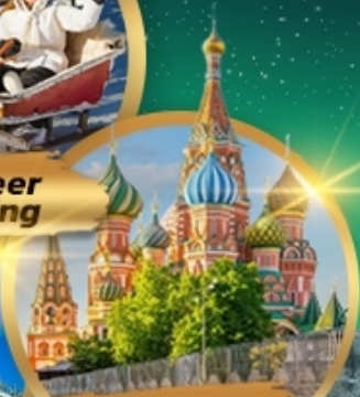
St. Basil's Cathedral