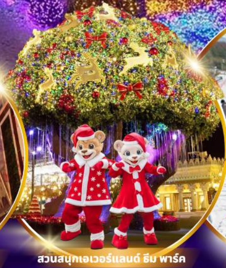
สวนสนุกเอเวอร์แลนด์ ฮิม พาร์ค