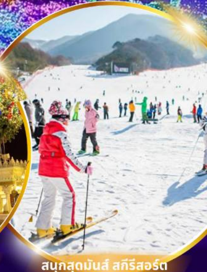
สนุกสุดมันส์ สกีรีสอร์ท

ชมจอ LED ขนาดยักษ์ที่รีสอร์ท 5 ดาว ใหญ่ที่สุดในเอเชียเหนือ สัมพัสมะสกีรีสอร์ท สนุกสุดมันส์ สวนสนุกเอเวอร์แลนด์ ชมพระราชวังคยองบกกุง ย้อนอดีตหมู่บ้านบุกซอน อันอก อิสระช้อปปิ้งคังนัม Lotte Duty Free