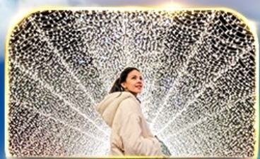
ชมงานประดับไฟนารานา โนะ ซาโตะ