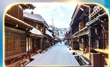
เมืองเก่าชินมาชิซูจิ