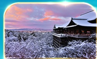
วัดคิโยมิจิ