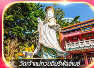
วัดเจ้าแม่กวนอิมรพาสลิมย์