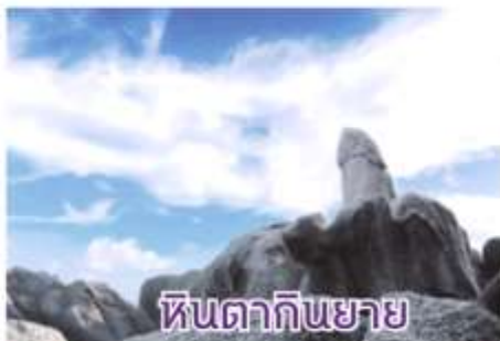
หินตากินยาย