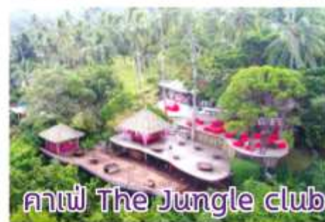
คาเฟ่ The Jungle club

16:30 น. ทุกท่านเตรียมพร้อมกับการขึ้นเรือ เพื่อออกเดินทางต่อ 18:00 น. เรือ Costa Serena อำลาเกาะสมุย มุ่งหน้า กลับสู่แหลมจิ้ง ค่ำ รับประทานอาหารค่ำ และร่วมปาร์ตี้สนุกๆ กับพนักงานเรือเป็นการส่งท้ายก่อนกลับ