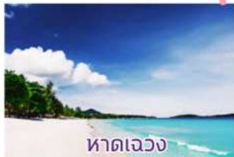
หาดเจว่ง