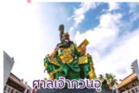
ศาลเจ้ากวนอู