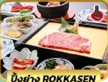
บั้งย่าง ROKKASEN