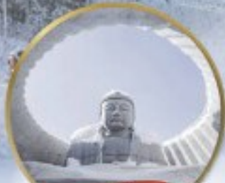
หุบเขา HILL OF BUDDHA