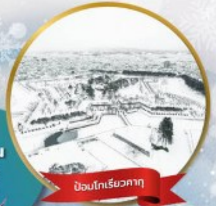
ป้อมโกเรียวกาคุ

หมู่บ้านนิงเกิลเกอเรส • สวนสัตว์อาซาฮิยาม่า • ชมขบวนพาเหรดเพนกวิน ตลาดเช้าฮาโกดาเตะ • ป้อมโกเรียวกาคุ • นั่งกระเช้าชมเมืองฮาโกดาเตะ ลานสกี • HILL OF BUDDHA • โฮตารุ • คลองโฮตารุ • หมู่บ้านราเมน