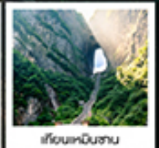
เวียงหนินฮาน

ทรนดัมคอน / สพานกั๋วเฟี้ยวโจว / เขาคิโยหนินฮาน / เรือชิงกั๋ว / ประตูสวรรค์ / ไร่มังกรจิ้งจอกขาว / เขาคิโยหนินฮาน สวนจอนพะเอ็งต๋อง / ทาฟวาทกราย / เมืองฟูหลงเจิน / ล่องเรือตามลำน้ำต๋อเจียง / เขามือโบราณฝ่งหวงยกน้ำดื่ม