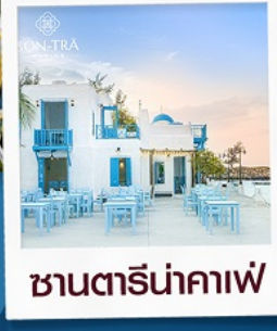
ซานตารีนาคาเฟ่