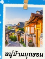
หมู่บ้านนุกซอน