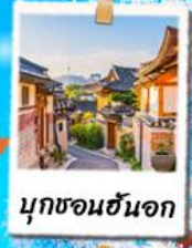
นุกซอนฮันจก