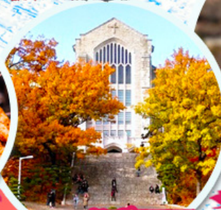
มหาวิทยาลัยฮีฮวา