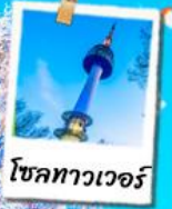
โซลทาวเวอร์