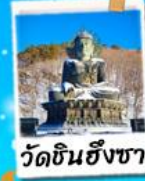
วัดชินฮึงซา