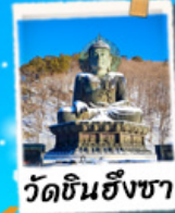
วัดชินฮังซา