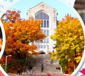
มหาวิทยาลัยฮ็ฮวา