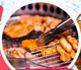
เมนูย่างเกาหลี