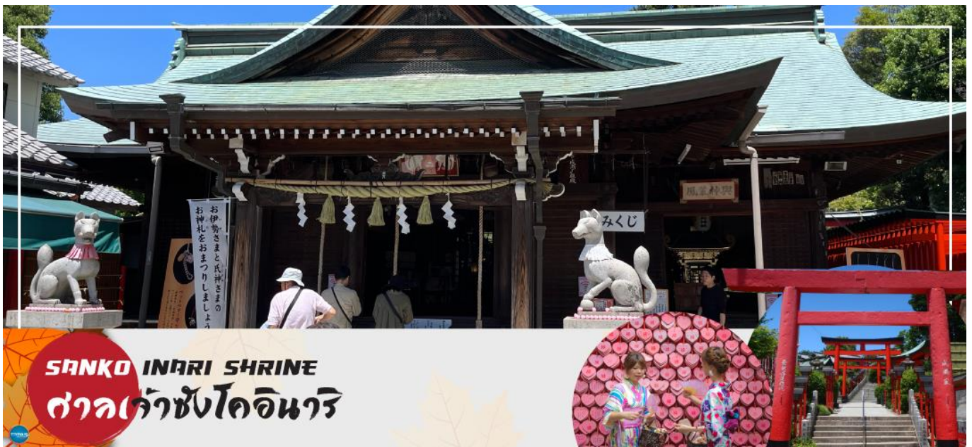
SANKO INARI SHRINE ศาลเจ้าซังโคอินาริ

จากนั้นนำท่านเดินทางสู่ ศาลเจ้าซังโคอินาริ (Sanko Inari Shrine) ตั้งอยู่ใกล้ๆ กับปราสาทอินูยามะ ศาลเจ้านี้มีชื่อเสียงเรื่องความรัก คู่รักมักจะมาขอพรให้มีความสัมพันธ์ที่ดี ชีวิตคู่ราบรื่น ครองรักกันยาวนาน ส่วนคนโสดก็จะขอให้ได้พบเจอคู่แท้จุดเด่นคือเสาโทริอิสีแดงที่เรียงรายสวยงาม และแผ่นป้ายขอพรรูปหัวใจสีชมพู ที่นี้ยังช่วยเรื่องการเงินอีกด้วย ว่ากันว่าถ้านำเงินมาล้างที่บ่อน้ำศักดิ์สิทธิ์ภายในศาลเจ้า จะช่วยให้เงินนั้นงอกเงยขึ้นหลายเท่า ครอบครัวเจริญรุ่งเรือง