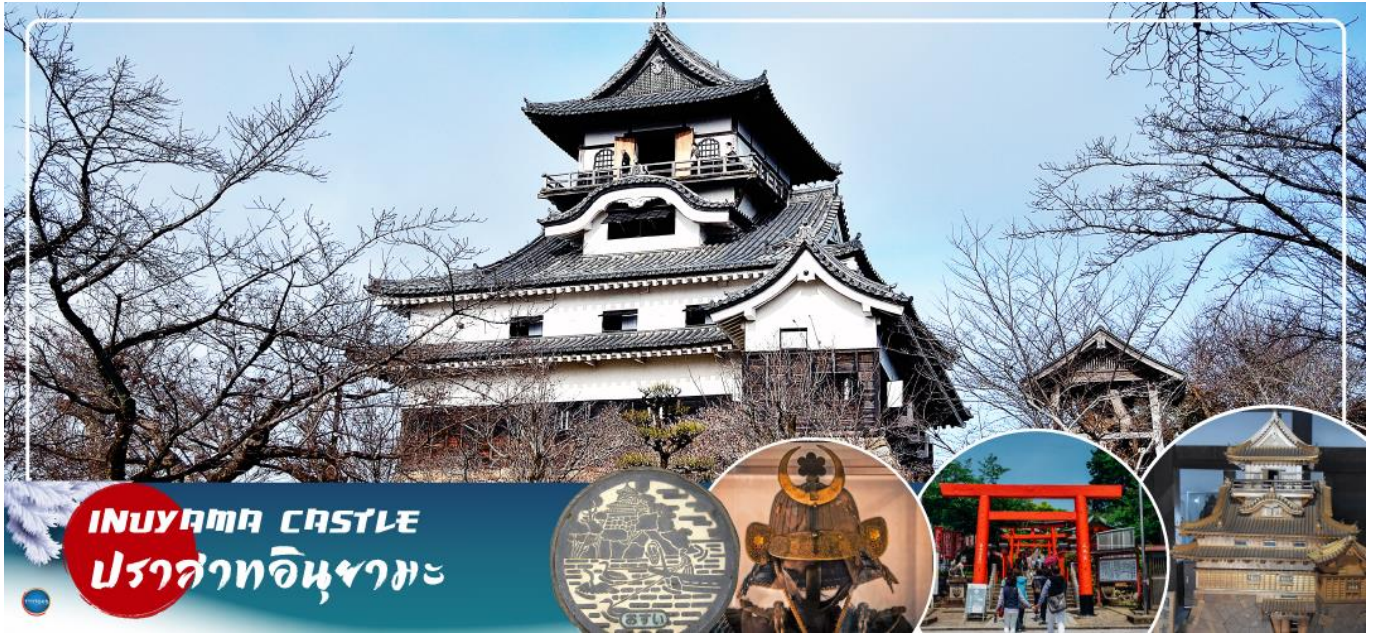
INUYAMA CASTLE ปราสาทอินูยามะ

จากนั้นเดินทางสู่ เมืองอินูยามะ (Inuyama) (ใช้เวลาเดินทางประมาณ 1.30 ชั่วโมง) จังหวัดไอจิ (Aichi) มีสถานที่ท่องเที่ยวชื่อดังหลายแห่ง ที่ขึ้นชื่ออย่างมาก นำท่านสัมผัสบรรยากาศความเป็นญี่ปุ่นที่หาได้เฉพาะในเมืองอินูยามะ