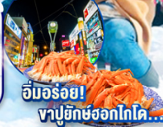
อิมมอร์อย! ชาปูยักษ์ฮอกไกโด...

ไฮไลท์!! สนุกสนาน ณ ลานสโนว์ เวิลด์ ซึคิโซพานิราม่า มหัศจรรย์ความสวยงาม วิจิตรตระการตา ณ พิพิธภัณฑ์หิมะ-ไอซ์พาร์วิลเลียน เดินชม คลองโอตารุ ในบรรยากาศสุดแสนโรแมนติก ช้อปปิ้งจุใจ อีออน เมืองอาซาฮิกาว่า และ ย่านซูซุกิโนะ อิมมอร์อย! ชาปูยักษ์