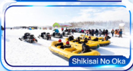
Shikisai No Oka