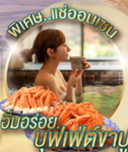
พิเศษ..!เซ่ออนเซน