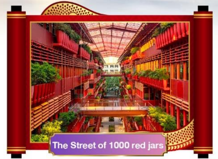
The Street of 1000 red jars

เดินทางโดยสายการบิน ไชน่าอีสเทิร์นแอร์ไลน์