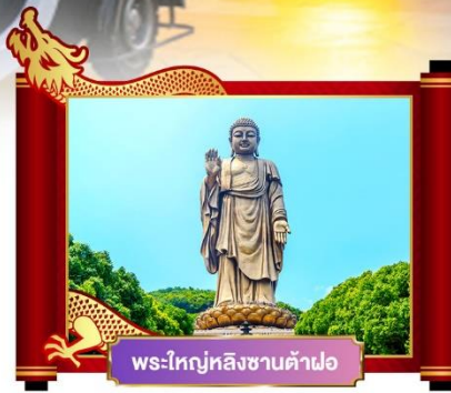
พระใหญ่หลังซานต้าฟอ