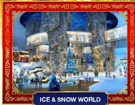
ICE &amp; SNOW WORLD