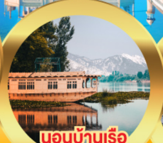
นอนบ้านเรือ วิวเขาหิมาลัย