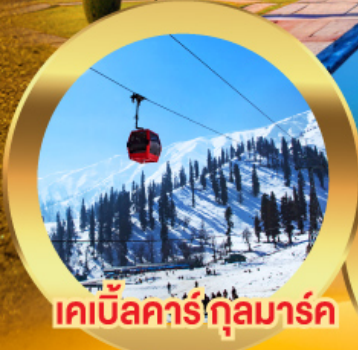
เคเบิลคาร์กุลมาร์ค