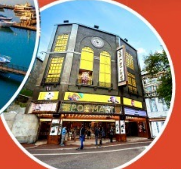
ร้าน POP MART ใหญ่ที่สุดในไต้หวัน