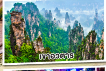
เหวอวตาร