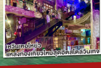
เทวียนหอไหย๋อ แหล่งท่องเที่ยวใหม่สุดฮิตสไตล์ลันเตง