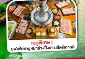
เมนูพิเศษ! บุฟเฟ่ต์ชาบูหม่าล่า+ปิ้งย่างสไตล์เกาหลี