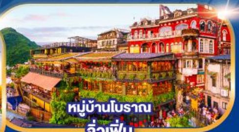
หมู่บ้านโบราณ จิวเฟิน