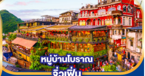
หมู่บ้านโบราณ จัวเฟิ่น