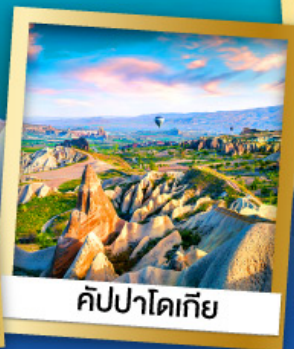
คัปปาโดเกีย