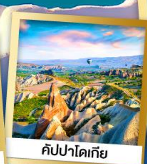
คัปปาโดเกีย