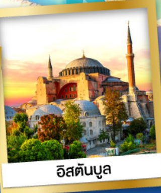
อิสตันบูล