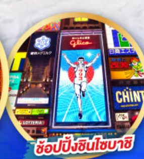
ช้อปปิ้งชินโซบาชิ

เดินทาง 14-19, 21-26 ม.ค. 68 06-11, 13-18 ก.พ. 68 13-18 มี.ค. 68