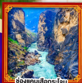
ช่องแคบเสื่อกระโจน