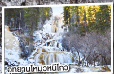
อุทยานโหมวหนี่โกว