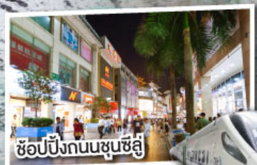
ช้อปปิ้งถนนชุนชี่