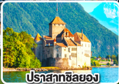
ปราสาทชิลยอง