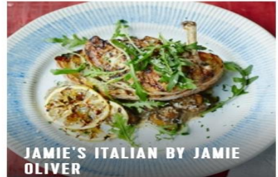
JAMIE'S ITALIAN BY JAMIE OLIVER