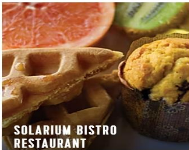
SOLARIUM BISTRO RESTAURANT