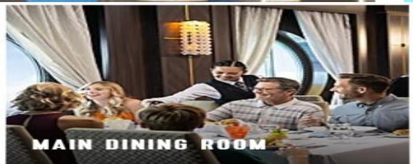
MAIN DINING ROOM