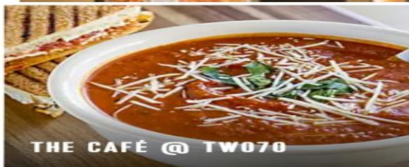
THE CAFÉ @ TW070