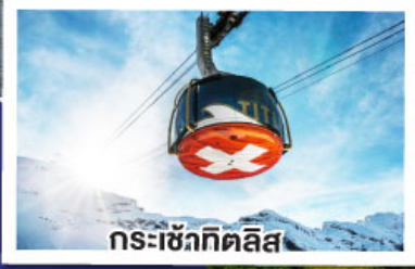
กระเช้าทิลิส