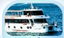
ล่องเรือ ช่องแคบบอสฟอรัส