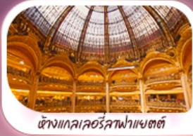
ตึกแกลเลอรีลูฟวร์