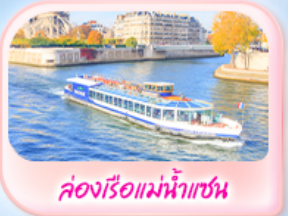
คองรีอแม่น้ำแซน