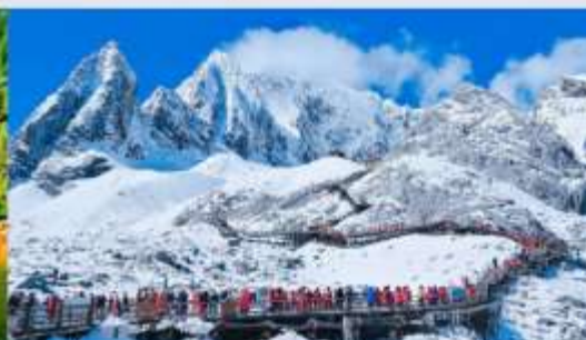
ภูเขาหิมะมิงกรหยก