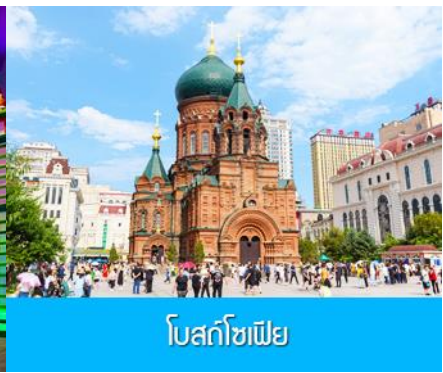
โบสถ์โซเฟีย