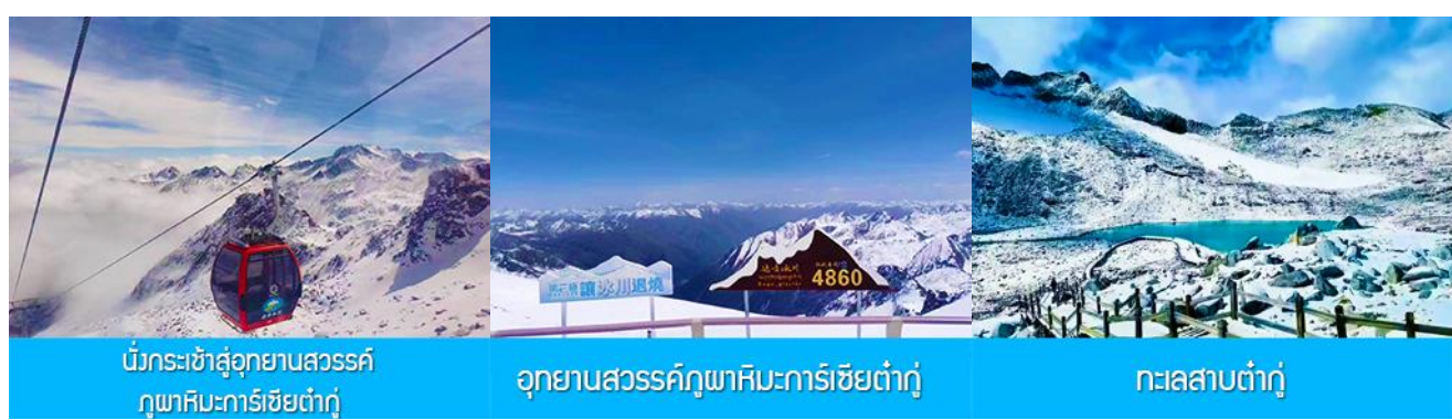
นั่งกระเช้าสู่อุทยานสวรรค์ ภูผาหิมะการ์เซียต้ากู่

พักที่ YARI INTER HOTEL 4* หรือ โรงแรมระดับเดียวกันท้องถิ่น