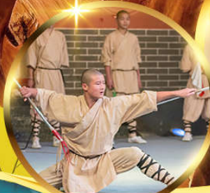
วัดเส้าหลิน