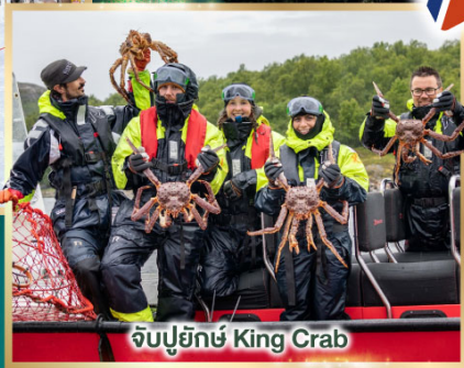
จับปูยักษ์ King Crab