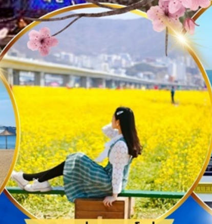
เทศกาลทุ่งดอกคาโนล่า