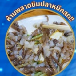
ห้ามพลาดชิมปลาหมึกสด!!

ชมซากุระจุใจ เทศกาลจินแฮ ชมดอกคามิเลียที่เกาะดองแบกโซม แวะถ่ายรูปทุ่งดอกคาโนล่า เหลืองอร่าม นั่งเคเบิลคาร์ ชมทะเลปูซาน ห้ามพลาด!! ตลาดปลาที่ใหญ่ที่สุด เซคอินแหล่งสุดชิค The Bay101 ช้อปปิ้งตลาดพื้นเมือง อิสระช้อปปิ้งได้ดิน ชัมยอน Lotte Duty Free