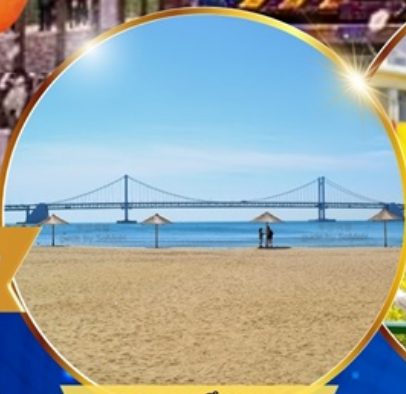
หาดแฮอินแด