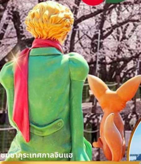
ชมซากุระเทศกาลจินแฮ