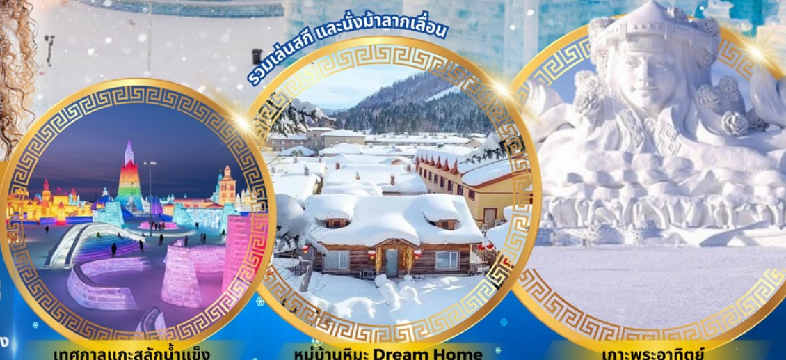
เทศกาลแกะสลักน้ำแข็ง

จตุรัสโบสถ์เซินโซเฟีย ถนนจงยาง หมู่บ้านหิมะดินแดนมหัศจรรย์ อนุสาวรีย์ฝั่งหง สนุกสนานกับลานสกียาปูลี ถนนแฉ่ยู่เจีย เขาแกะหลัว เขาปังจู่ย ภาพเขียน Ice and Snow แม่น้ำซงฮัวเจียง โซ่วว้ายน้ำแข็ง เกาะพระอาทิตย์