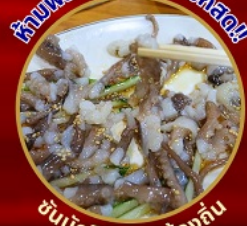
ชั้นนักจ๊อ อาหารท้องถิ่น