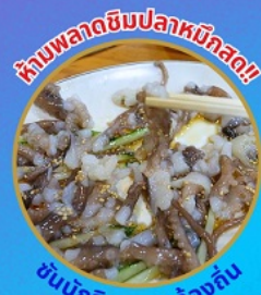
ห้ามพลาดชิมปลาหมึกสด!! ซันนากิ อาหารท้องถิ่น

ถ่ายรูปชิคๆ หมู่บ้านวัฒนธรรมคิมซอน ใหม่ล่าสุด คาเฟ่ริมทะเล วิวหลักล้าน ชมอุโมงค์ดินเมเปิ้ล สีส้มแดง ถ่ายรูปกับหลญาสีชมพู สดใส ขึ้นเคเบิลคาร์ ชมทะเลปูซาน ห้ามพลาด!! ตลาดปลาที่ใหญ่ที่สุด ชิมของอร่อยที่ตลาดแฮจุนแด อิสระช้อปปิ้ง Lotte Duty Free