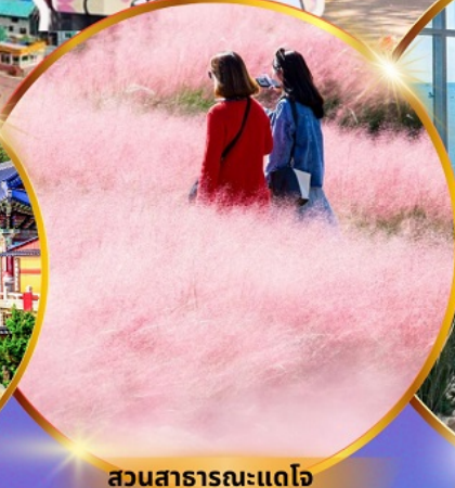
สวนสาธารณะแดโจ