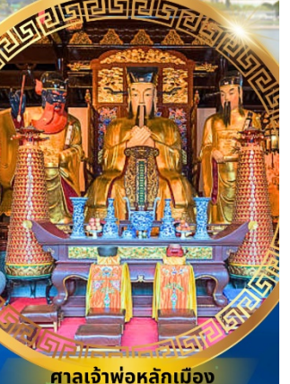
ศาลเจ้าพ่อหลักเมือง