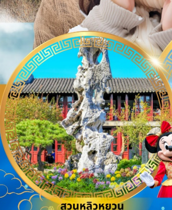
สวนหลิวหยวน