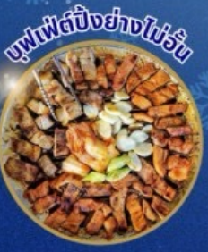
บุฟเฟ่ต์ปิ้งย่างไม่วัน