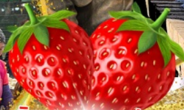
มีผลตอบเอบอจ้สุด ๆ จากรั้